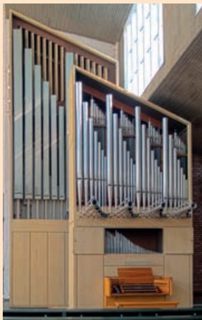
Kath. Pfarrkirche, Klais-Organ (1975) 3 Manuale · 42 Register